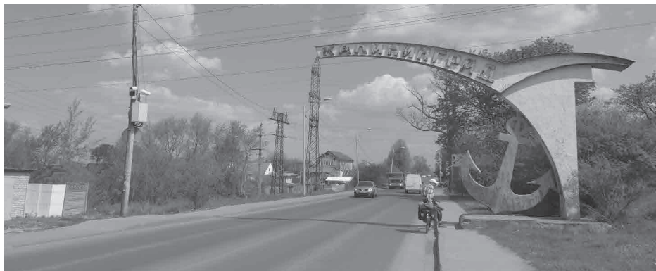
Einfahrt nach Kaliningrad

1100 km auf dem polnischen, russischen und litauischen Ostseeküstenradweg, Vortrag und Diaschau von Birgit und Volker Götz